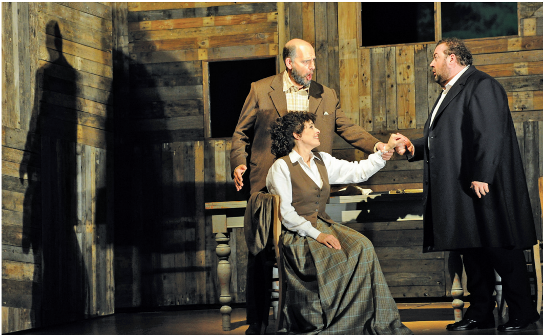
un momento de la representación del melodrama trágico 'Luisa Miller'

C ultura Segundo título de los tres programados por ABAO esta temporada